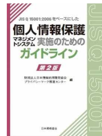
写真は第2版のもの

【審査基準の事前周知の一環】 JIS改正とほぼ同時期に 「JIPDECガイドライン(新版)」 の公表を計画しています